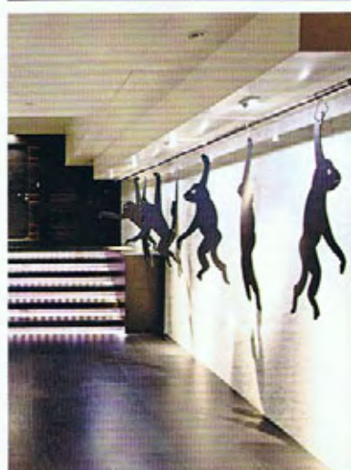
Sopra, l'area piscine della spa. A sinistra, un'opera di Sergio Fermariello, appositamente realizzata per l'hotel. Nell'altra pagina, le cinque city spa scelte dai VdS.

più urban-chic della città, restaurato dallo studio dell'archistar Kenzo Tange . Da non perdere, infine, la collezione d'arte contemporanea con installazioni di grandi artisti, come Mario Schifano e Mimmo Paladino, e fotografie di Napoli, vintage e non. La posizione è strategica: piazza del Plebiscito è a cinque minuti a piedi, il centro storico a dieci e la banchina con i traghetti per le isole del Golfo è davanti all'hotel. Per uno spuntino lo Zero Sushi Bar è un angolo di Sol Levante dentro al Romeo, con anche chef e servizio in camera no stop. La serata finisce (o inizia) al Beluga SkyBar , al nono piano. Con un bicchiere di champagne e una terrina di caviale (assaggiate quello aromatizzato all'erba cipollina, con scalogno, uova mimosa, panna acida e cetriolini). Si esce sulla terrazza: le luci di Capri sono all'orizzonte.