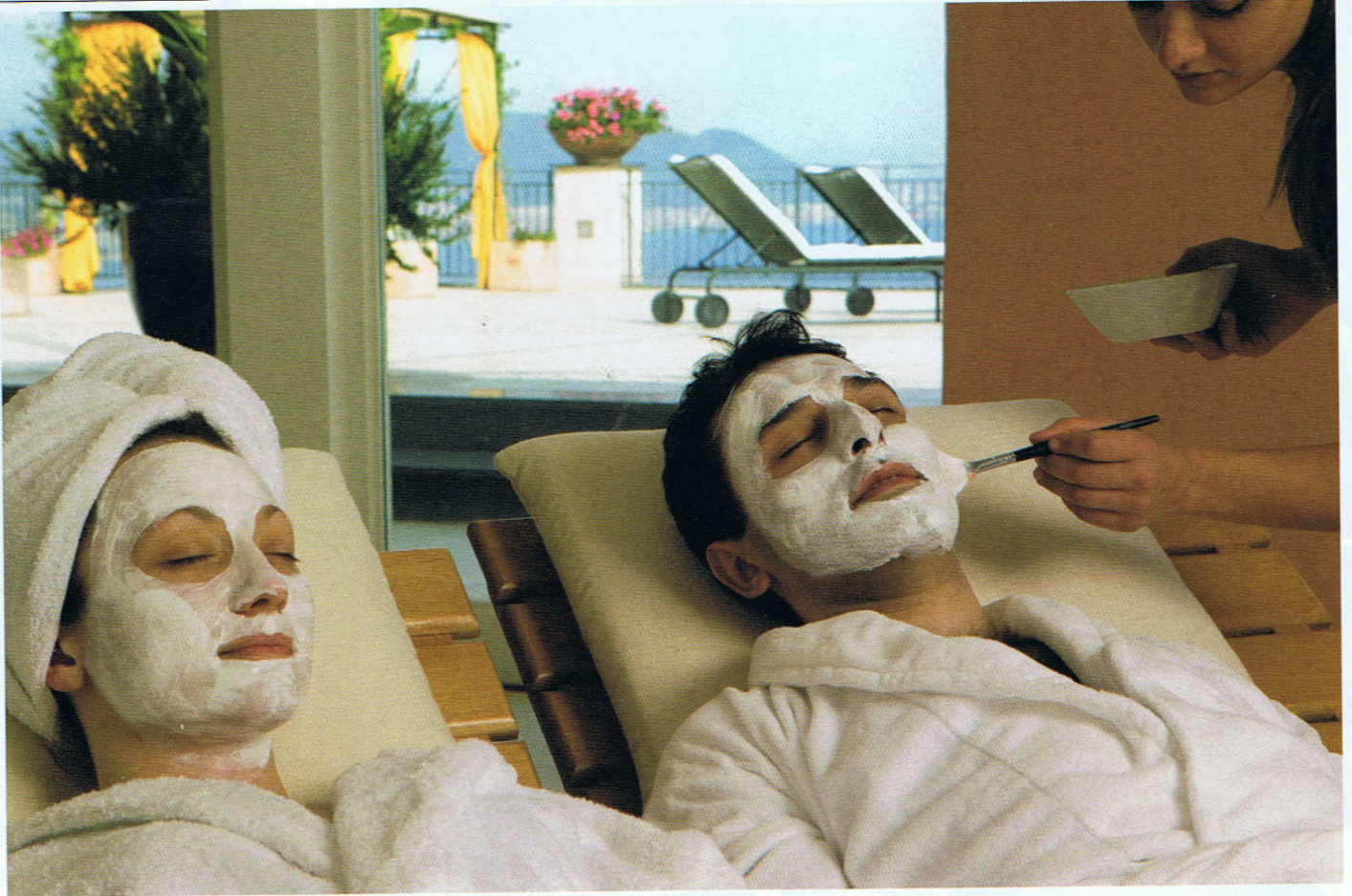
LE SPA / Un trattamento presso la SPA dell'hotel Raito.

sale micronizzato allo stato puro con effetti drenanti e decongestionanti ( www.doganadelsale.it ). Il consiglio è di iniziare la propria giornata di remise en forme sempre con uno scrub per rimuovere le cellule morte e le tossine, poi una sauna o un bagno turco, una pausa di relax con tisana o centrifuga di frutta e quindi un meraviglioso massaggio agli olii essenziali. Per un trattamento di coppia da sogno l'Hotel Raito è un indirizzo speciale nell'incanto della Costa d'Amalfi, a pochi chilometri dalla bella Vietri sul Mare ( www.hotelraitto.it ). Qui ci si lascia coccolare con i trattamenti dell'esclusiva ExPure SPA: trattamento viso personalizzato, trattamento esfoliante corpo, epilazione, maschera nutriente mani, manicure SPA, pedicure SPA, scrub piedi, massaggio Total Body, massaggi antistress e 2 ingressi con percorso benessere (piscina interna riscaldata con idromassaggio, doccia emozionale cromo-terapica, sauna, bagno turco, solarium, relax con tisana). Altro indirizzo per ritrovare bellezza e benessere è il Savoy Beach hotel di Paestum dove potrete immergervi nella piscina coperta riscaldata a 37 gradi con idromassaggio o provare il bagno turco energizzante, qui tutto è stato studiato per una vacanza ritemprante, per un piacere multisensoriale e per cacciare via lo stress di tutti i giorni ( www.savoybeachhotel.it ). •