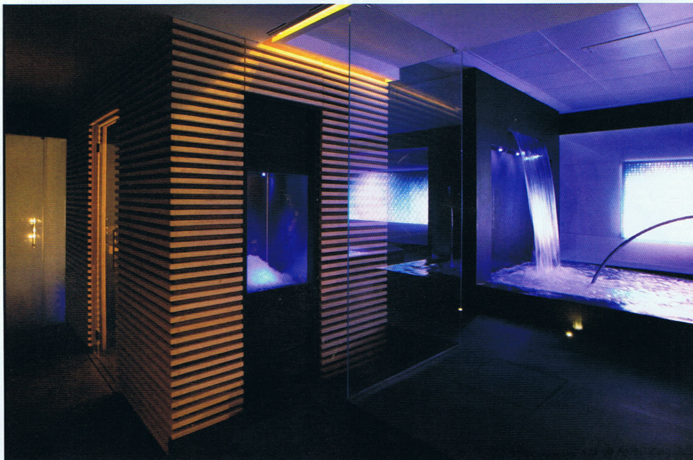
LE SPA / La luxury SPA del Romeo hotel

No-stress , è questa la parola d'ordine a pochi giorni dal sì. Rilassarsi prima del grande evento è importante. Fa bene allo spirito e al corpo, riattiva l'energia vitale che è in noi e ci rende più belle. L'ideale sarebbe regalarsi almeno una settimana di coccole e remise en forme, e non è necessario partire ed andare lontano. In città e negli immediati dintorni le offerte sono tante e molte sono confezionate ad hoc per i futuri sposi, sia per lei che per lui. Dalla formula Day-spa al weekend di bellezza (anche come idea per un originale addio al nubilito). L'ultima novità in fatto di benessere è senza dubbio la Dogana del Sale, la luxury spa di Romeo hotel, esclusivo cinque stelle di design di Napoli. La spa si articola su una superficie di mille metri quadrati di puro design e tecnologia all'avanguardia con luci che cambiano intensità e colore, pareti d'acqua e materiali tattili. I trattamenti personalizzati rilassanti e detossinanti sono tanti e sono da abbinare al percorso benessere nella "zona umida" composta da sauna finlandese, bagno turco, tepidarium con pareti di sale rosa dell'Himalaya, frigidarium a cascata di neve, percorso Kneipp, tre mini pool idromassaggio con fondo in mosaico di oro bianco. Un toccasana è la Stanza del sale, uno spazio interamente rivestito di sale bianco dove si respira